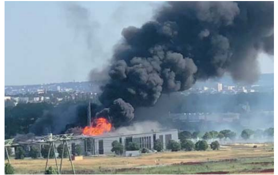
L'incendie du 3 juillet 2019 dans l'unité de clarifoculation

la note obtenue est de 1,5/5 (niveau d'acceptabilité 3,5)